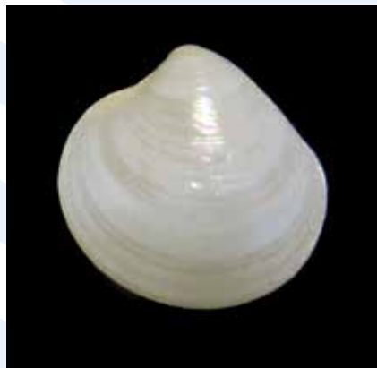
L-Arzella Dosinia sp.