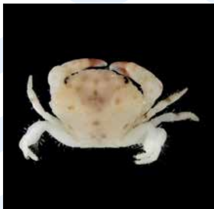
Il-Granċijiet eż. Xantho pilipes

Min-naħa tagħhom dawn l-animali jservu ta' ikel għal invertebrati akbar minnhom u għal ħut żgħir, u għalhekk jiffurmaw parti essenzjali min-nisġa tal-ikel fl-ambjent tal-baħar.