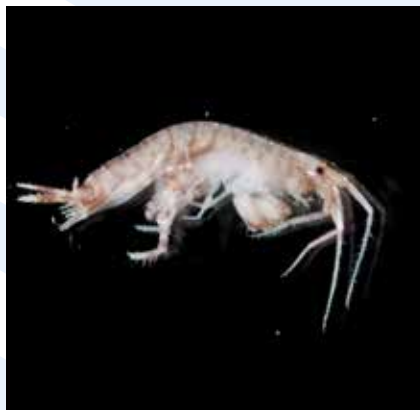
Il-Krustaċġi anfipodi eż. Melita sp.