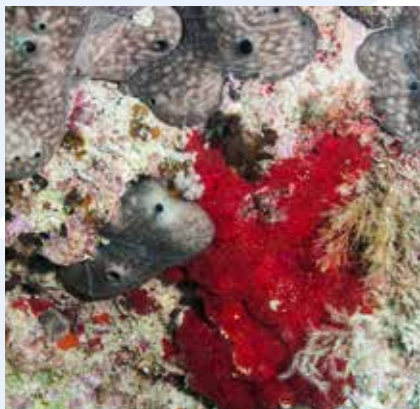
L-Ispanoż (l-irqajja' griži u ħomor)

Foresti sfieq ta' algi jinstabu fuq il-blat u ġebel kbir li hemm f'qiegħ il-baħar fil-parti tax-xlokk tar-Ramla tal-Mixquqa. Hemmhekk, f'fond ta' iżjed minn 3 m, wieħed jinnota varjetà ta' invertebrati b'kuluri jgħajtu, bħal: