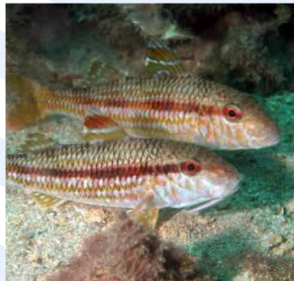
It-trilja tal-faxxi Mullus surmuletus