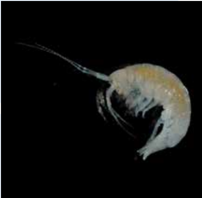
Krustaċġi anfipodi eż. Ampithoe spp.

Il-qiegħ baxx ġebli bl-algi jhaddan fih diversità kbira ta' fauna ta' daqsijiet differenti, minn inqas minn millimetru sa xi 10 ċm, li jinkludu: