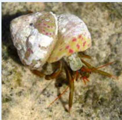
Il-Granċijiet tal-bebbux eż. Clibanarius erythropus