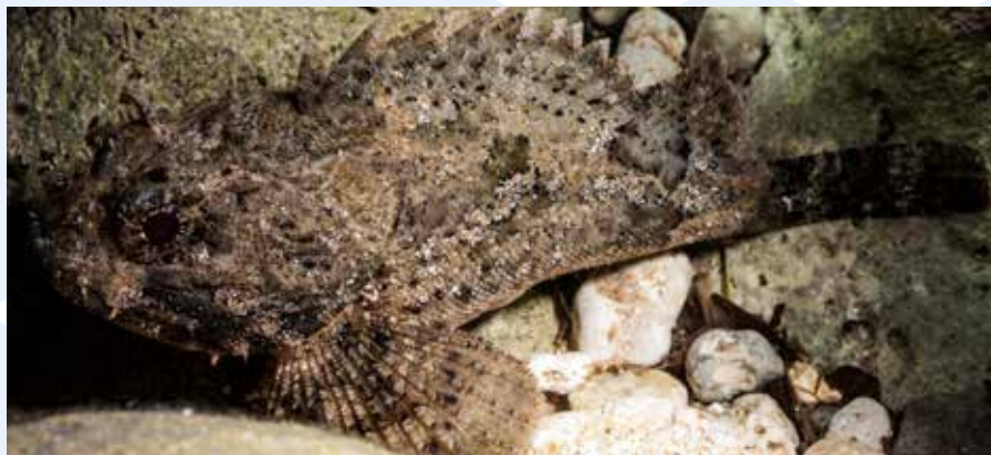
L-Iskorfna sewda Scorpaena porcus