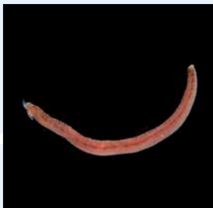
Il- Ħniex Opheliidae spp.