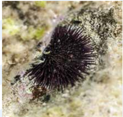
Ir-Rizza Paracentrotus lividus