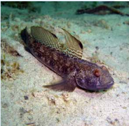
il-mazzun Gobius sp.

Speċi tipiċi ta' ħut jinkludu l-mulett Mugil cephalus , (bħal fir-ritratt t'hawn fuq), u t-trilja tal-faxxi Mullus surmuletus , (bħal fir-ritratt t'hawn taħt), li għandha par organi bħal mustaċċi fil-għnub ta' ħalqha li jintużaw biex issib il-priża (eż. invertebrati żgħar) mohbija fir-ramel.