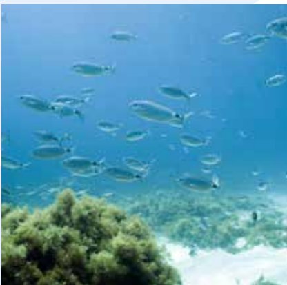
Il-Kaħli Oblada melanura

Fejn hemm ġebel kbir, l-aktar speċi komuni ta' ħut, u li aktarx tarah jgħum fi ġliba, huwa ċ-ċawl Chromis chromis , (bħal tar-ritratt t'hawn fuq), il-kaħli Oblada melanura , u x-xilep Sarpa salpa , (bħal tar-ritratt t'hawn taħt).