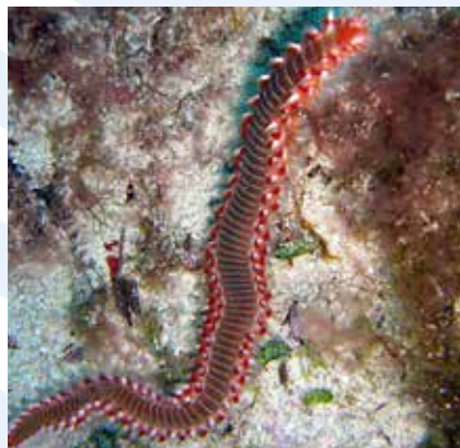
Il-Busuf Hermodice carunculata