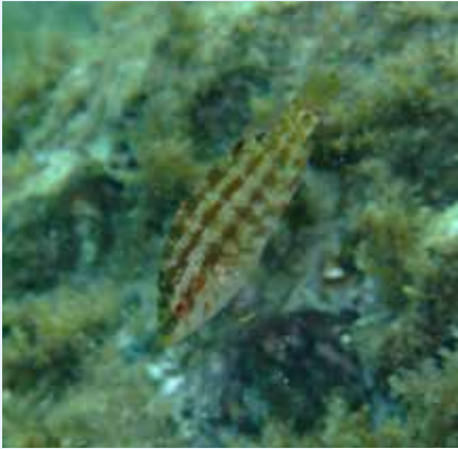
It-Tirda Mirlija Symphodus tinca

Speċi oħrajn ta' ħut li wieħed jista' jiltaqa' magħhom jinkludu: