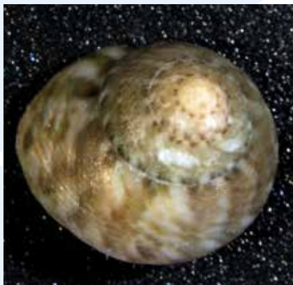
Il-Bebbux eż. Gibbula spp.

Taht ix-xatt f'ilma baxx fil-parti tax-Xlokk tal-Bajja tal-Mixquqa wiehed isib gzuz ta' ċagħaq u ġebel, li jservu ta' ambjent naturali għal diversi speċi ta' invertebrati żgħar, fosthom: