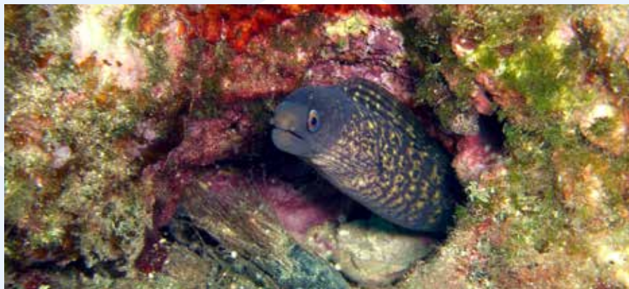
Moray Eel Muraena helena

Meta ghaddas jgharrex sew qalb il-ġebel kbir u fl-ispazji ta' tahtu, jista' jilmah individwi ta' speċi oħra ta' ħut, bħal: