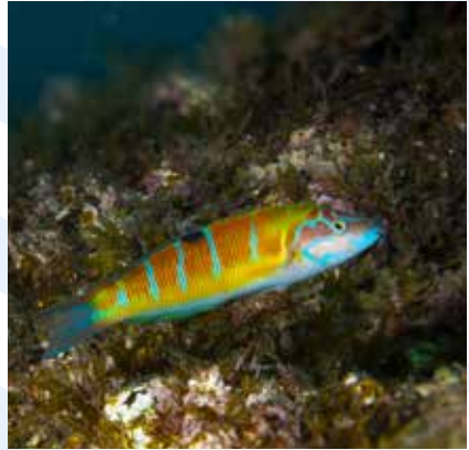
Il-Lhudi Thalassoma pavo