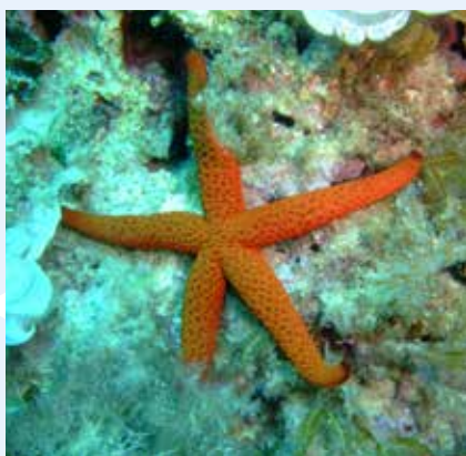
L-Istilla Ħamra Echinaster sepositus