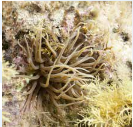
L-Artikla Ħadra Anemonia viridis