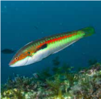
L-Għarusa Coris julis