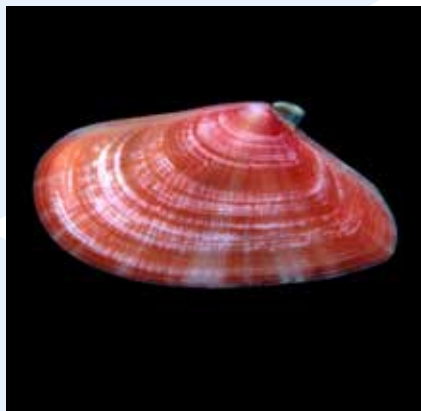
L-Arzella Tellina sp.

Speċi ta' fawna li tipikament jgħixu f'dan l-ambjent jinkludu: