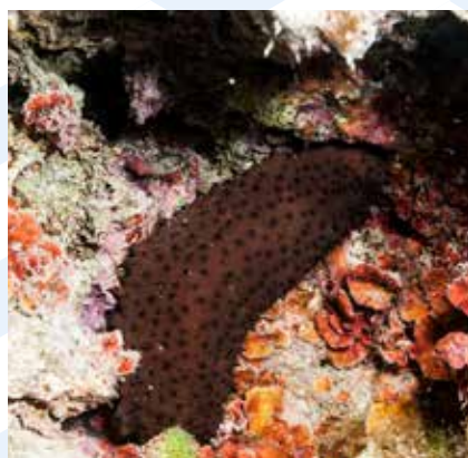
Il-Buzzu Holothuria poli

Jekk għaddas jittawwal taħt xi blata jkollu iżjed ċans li jilmaħ dawn l-ispeċi.