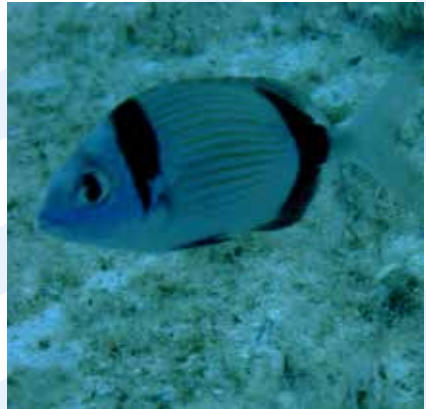
Ix-Xirgjen Diplodus vulgaris