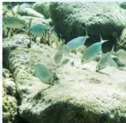
Ix-Xilep Sarpa salpa