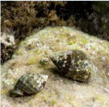
Il-Bronja Safra Stramonita haemastoma