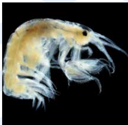
Il- Krustaċji anfipodi e.ż. Liljeborgia dellavallei