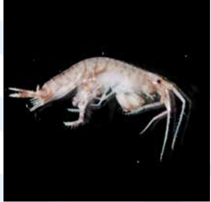
Il-Krustaċġi anfipodi eż. Melita sp.