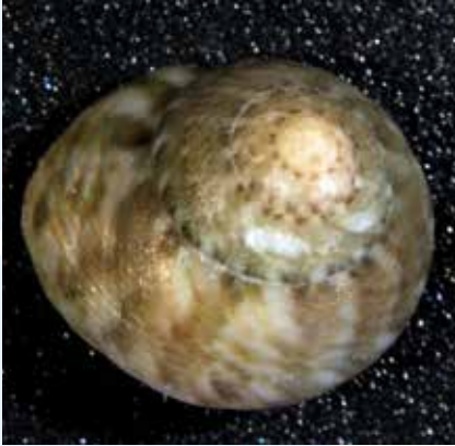
Il-Bebbux eż. Gibbula spp.

Taht ix-xatt f'ilma baxx fil-parti t'isfel tal-Bajja t'Ghajn Tuffieha wiehed isib gzuz ta' ċagħaq u ġebel li jservu ta' ambjent naturali għal diversi speċi ta' invertebrati żgħar, fosthom: