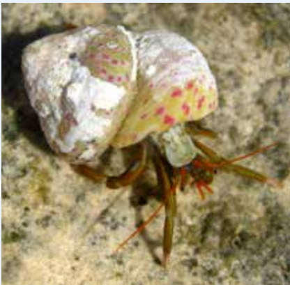
Il-Granċijiet tal-bebbux eż. Clibanarius erythropus