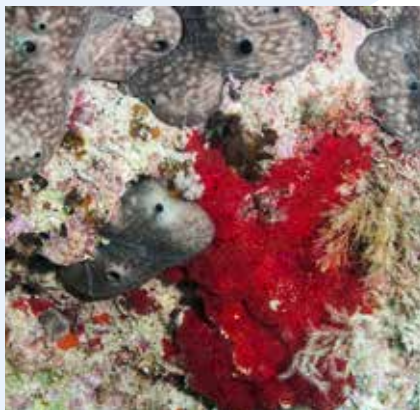
L-Isponoż (l-irqajja' griži u ħomor)

Foresti sfieq ta' algi jinstabu fuq il-blat u ġebel kbir li hemm f'qiegħ il-baħar fil-parti t'isfel tal-Bajja ta' Ghajn Tuffieħa. Hemmhekk, f'fond ta' iżjed minn 3 m, wieħed jinnota varjetà ta' invertebrati b'kuluri jgħajtu, bħal: